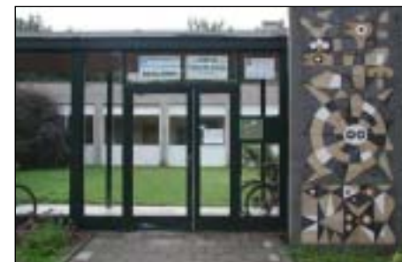
Benjamin, hlavní vchod

V rodinném prostředí - poradenství v oblasti postižení a vývoje dítěte, návrh stimulačního programu a herní terapie, podpora rodiny v době krize, zprostředkování kontaktů na odborníky, sociálně právní poradenství, pomoc při výběru předškolního či školního zařízení, půjčování hraček, pomůcek, literatury.