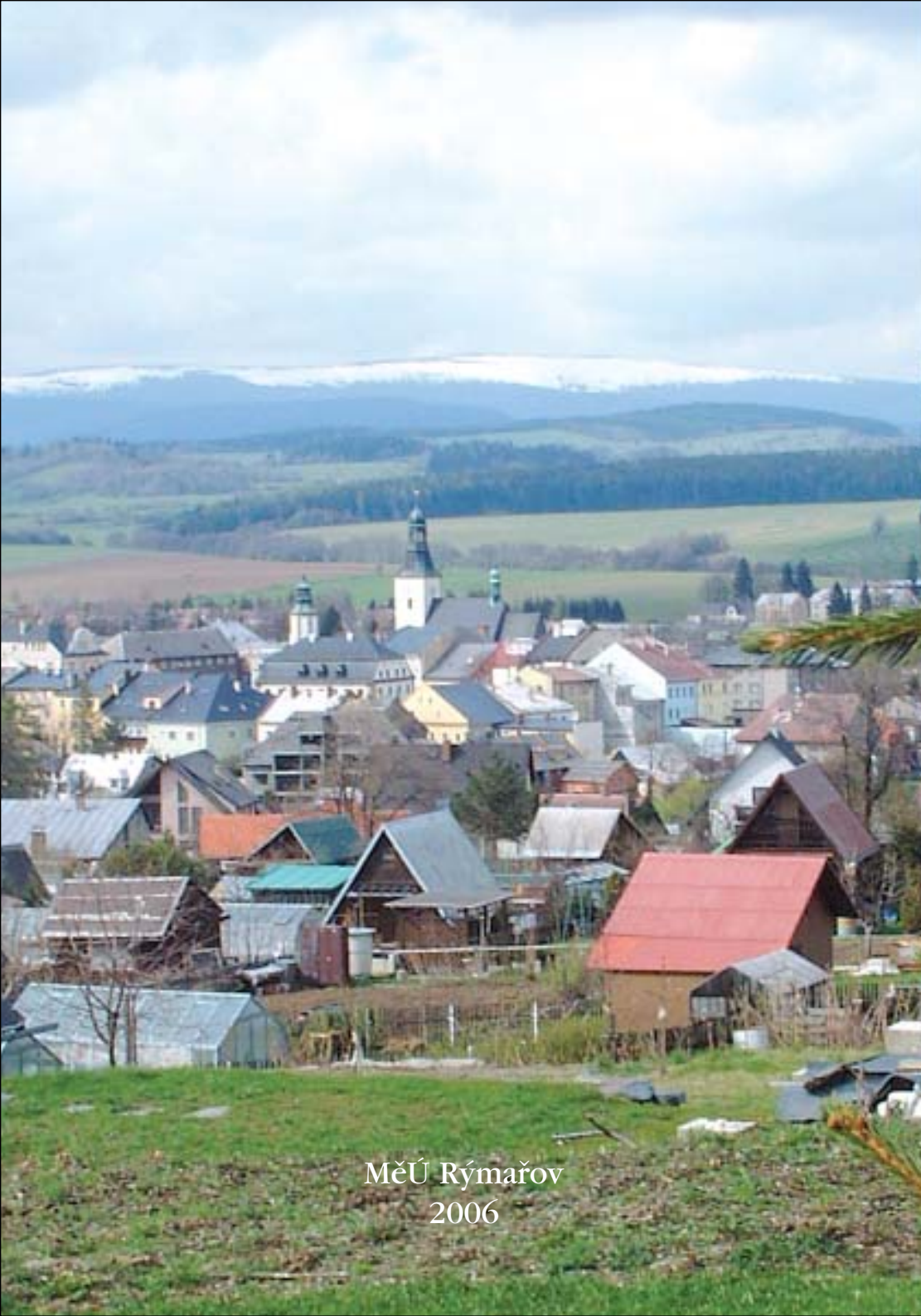
MěÚ Rýmařov 2006